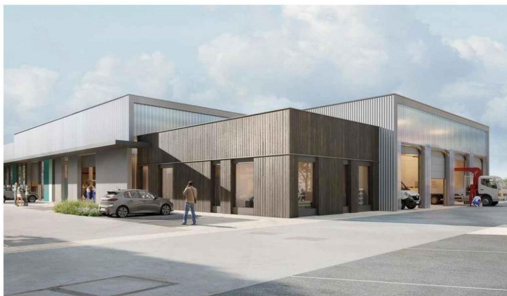
La construction du futur centre technique municipal, étalée sur deux ans, consommera à elle seule près d'un quart du budget 2024 dédié aux investissements. Illustration Brière architectes

Évoqué depuis l'arrivée aux affaires de Christophe Arminjon, ce projet sera l'un des plus coûteux du mandat. Évalué à 16 millions d'euros - lors du vote du budget 2022 - par le Plan pluriannuel d'investissement (PPI), son prix a, depuis, bien augmenté. Il est aujourd'hui estimé à près de 22 millions d'euros. La construction de ce bâtiment de 27 000 m 2 dans la zone d'activités de Vongy vise à regrouper en un même lieu l'ensem-